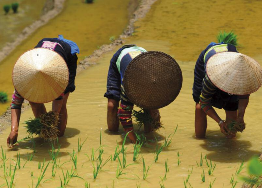
Plantation du riz chez les Lolo noirs, Région de Cao Bang, Vietnam, 2015

Corps pliés, gestes précis du repiquage des plants de riz, répétition de la tâche, dont l'image distribue les séquences entre les trois travailleuses. Des femmes ? Les chapeaux coniques nous dissimulent leur identité, mais l'on sait par les voyageurs (qui transforment en spectacle ce labeur traditionnel, ingénieux et harassant) que la division sexuelle réserve le travail titanesque dans les rizières aux femmes de l'ethnie Lolo. La vie travaille trois fois : la vie végétale, verte, la vie de l'eau boueuse, ocre, et la vie humaine, tannée par le soleil. Les milliards de grains de riz produits sont rapportés à leur origine : le labeur des corps.