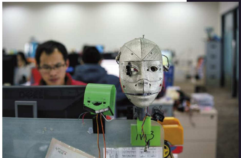
Siège d'une entreprise de robotique open source - Shanghai, Chine, 2015

La robotique, l'intelligence artificielle : des inquiétudes non justifiées. C'est l'homme qui définit ce que fait le robot doté de précision mais condamné à la répétition, à des comportements artificiels sans intelligence. L'homme flou ici est pleinement créatif, il peut prendre des chemins de traverse pour faire face à l'imprévu. Le travail ? C'est ce que le standard, la prescription n'ont pas anticipé. Le défi pour les sciences du travail ? C'est de rendre acceptable l'activité avec ces dispositifs mais aussi d'anticiper leurs conséquences sur le travail de demain.