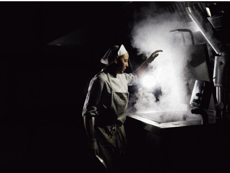
Cuisines de l'hôpital, Asti, Italie, 2011

Chaque jour, dans les coulisses obscures de nos organisations, des millions de personnes s'affairent à la tâche. Dévouées, elles produisent de tout petits riens tellement indispensables. Contribuer au traitement des patients en produisant leurs repas avec un soin parfois imperceptible. Loin des projecteurs, découvrir ce travail caché, entre ombre et lumière, est une étape dans la (re)connaissance du monde.