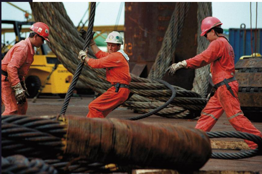
Forage pétrolier sur la Mer Noire, Turquie, 2001