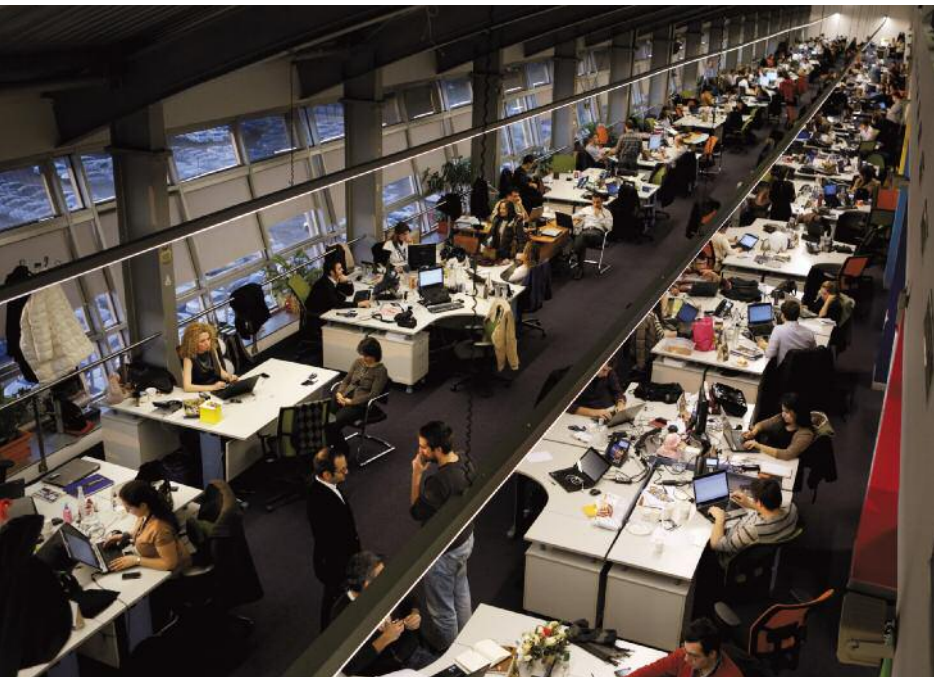
Bureaux de la Turkcell, opérateur de téléphonie, Istanbul, Turquie, 2013

Cette exposition procède d'une démarche citoyenne, en s'intéressant aux préoccupations immédiates du monde contemporain et à ses réalités tant sociales qu'économiques et politiques. Et ces images deviennent alors autant d'incitations à penser le travail afin que chacun acquière une plus grande maîtrise de ce qui constitue indéniablement une dimension fondamentale de la vie.