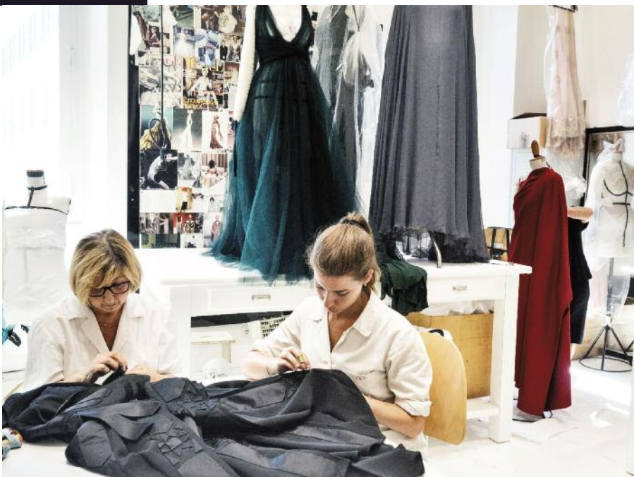
Atelier de la maison de couture Valentino, Rome, Italie, 2015

M ai 1917, Chemin des Dames, résonne « Ceux qu'ont le pognon [...] c'est pour eux qu'on crève ; on va se mettre en grève ». Paris, 10 heures par jour pour 1 à 5 francs, les mininettes des Maisons de Couture confectionnent les habits de la bonne société dont les dames de Généraux « bouchers ». Elles entrent en grève, envahissent les Champs-Élysées. La mobilisation féminine gagne les usines de guerre. Le patronat concède un franc et la loi du 11 juin consacre la semaine anglaise. La création de l'OIT s'inscrit dans des luttes perpétuées et amplifiées par les travailleuses chez les belligérants : « Une paix universelle et durable ne peut être fondée que sur la base de la justice sociale ».