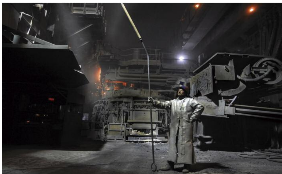
Fondeur à l'aciérie de Saint-Saulve dans le Nord, France, 2008

Philippe CABON Maître de conférences en Ergonomie Université Paris Descartes