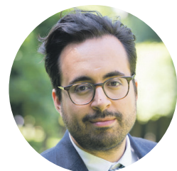
Mounir Mahjoubi, secrétaire d'État auprès du premier Ministre, chargé du Numérique

« Nous n'allons pas subir la transformation numérique, nous allons la mener. Nous allons préparer nos citoyens à réaliser les transitions dont nous avons besoin. Le numérique recrute et le numérique permet des transitions sociales majeures. Il ouvre des portes et comprend qu'il faut les ouvrir très grands, aux jeunes et aux personnes sans emploi. Ces 10 000 formations sont l'amorçage d'une ambition forte, faire du numérique un levier de retour à l'emploi et d'émancipation. »